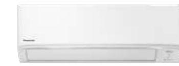
CS-KU9WKT | CS-KU13WKT | CS-KU18WKT