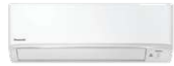
CS-XKU9WKT | CS-XKU13WKT | CS-XKU18WKT