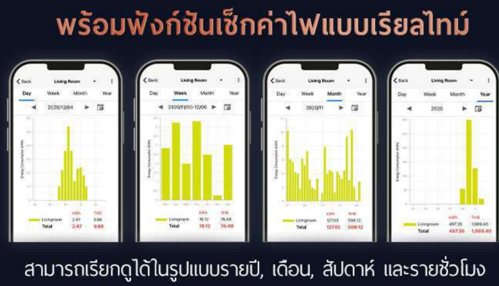
สามารถเรียกดูได้ในรูปแบบรายปี, เดือน, สัปดาห์ และรายชั่วโมง

สั่งงานแอร์ได้ด้วยเสียงผ่าน Smart Phone ไม่ว่าจะอยู่ที่ไหนก็สะดวกเกินคาด