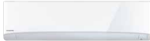
CS-PN18UKT | CS-PN24UKT | CS-PN30UKT