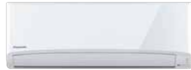
CS-PN9UKT | CS-PN12UKT

แบบติดตั้ง : STANDARD Non-INVERTER Single-Split Type