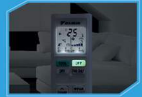
รีโมทแบบเรืองแสง ใช้งานง่ายในที่มืด