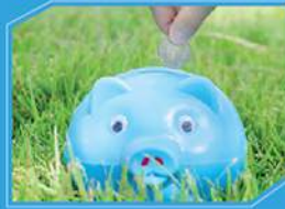
ประหยัดไฟ ด้วยคอมเพรสเซอร์แบบสวิง