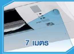
ระบบอัจฉริยะ: ลดการใช้พลังงาน เมื่อไม่มีคนอยู่ในห้อง