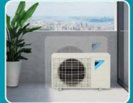
ขนาดกะทัดรัด ติดตั้งในพื้นที่แคบได้