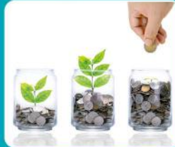
ประหยัดไฟ ด้วยระบบอินเวอร์เตอร์แบบสวิต